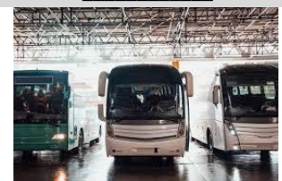
61. La _____.