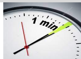
79. El _____.