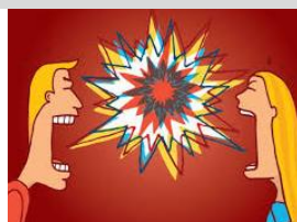
78. El _____.