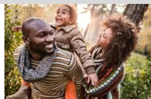
76. La _____.