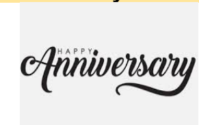
71. El _____.