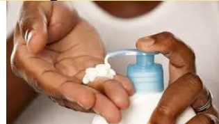
56. La _____.