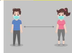
60. La _____.