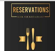
70. Las _____.