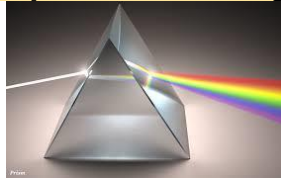
57. El _____.