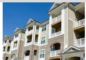
77. La _____.