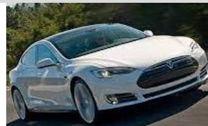
84. El _____.