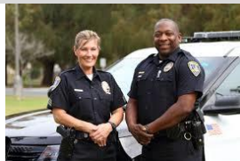
83. La _____.