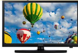
58. La _____.