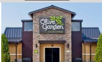
62. El _____.