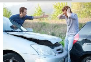
64. El _____.