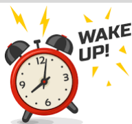
82. La _____.