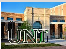
63. La _____.