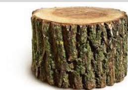
81. El _____.