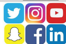
65. La _____.