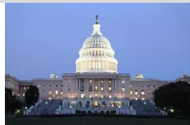
68. La _____.