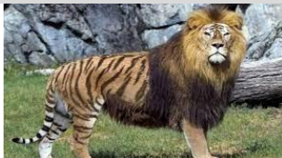
67. El _____.