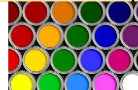
75. Los _____.