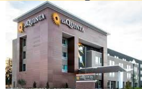
59. El _____.