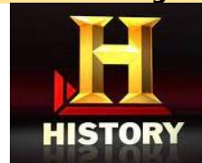
74. Los _____.